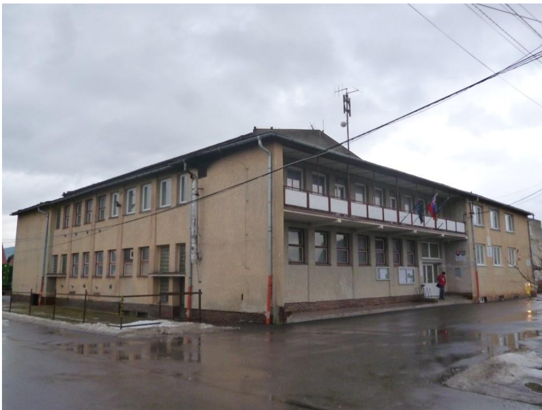
Budova OU pred rekonštrukciou.