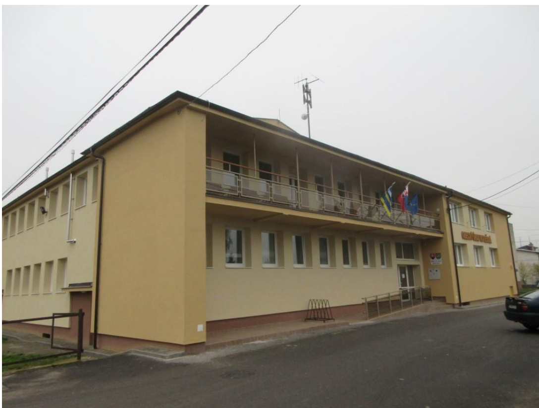
Budova OU po rekonštrukcii.